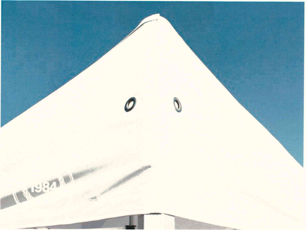
Abb. kann in Farbe abweichen