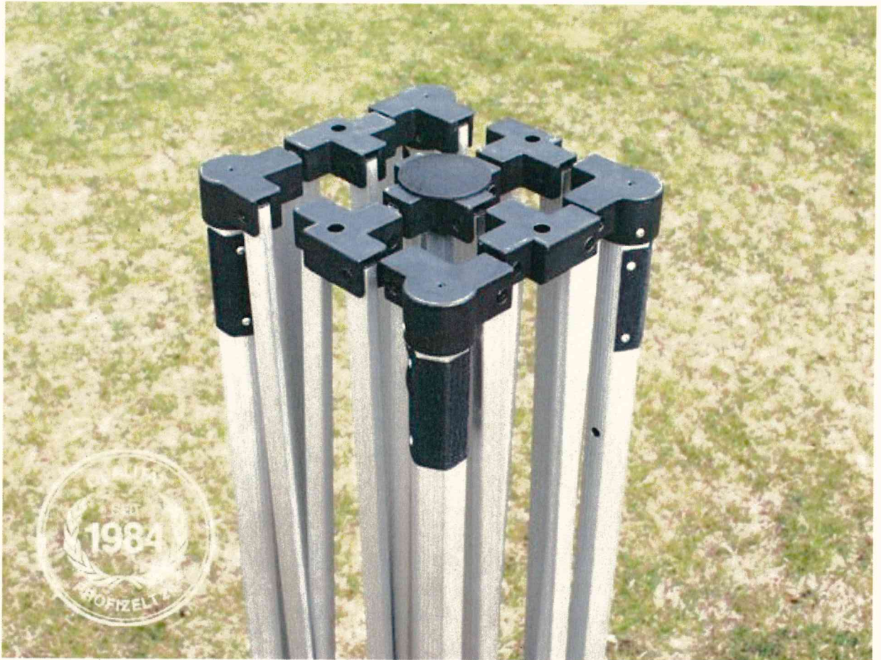
Abb. kann in Farbe abweichen