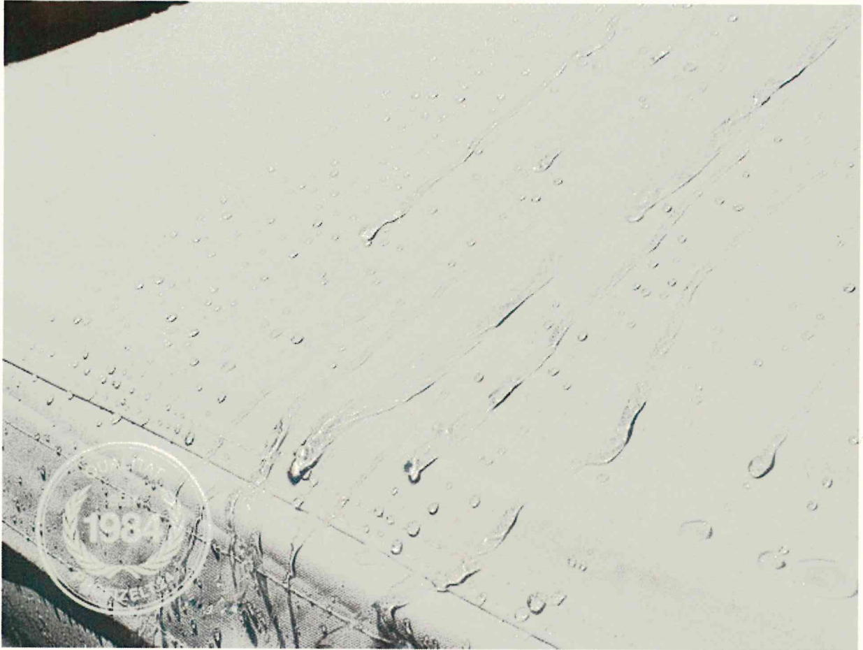
Abb. kann in Farbe abweichen